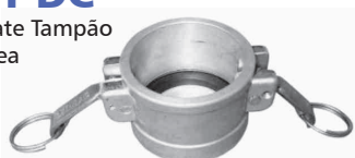
EFT-DC Engate Tampão Fêmea