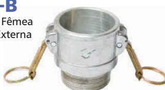
EFE-B Engate Fêmea Rosca Externa