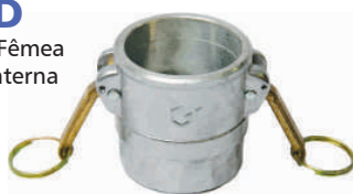
EFI-D Engate Fêmea Rosca Interna