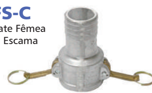
EFS-C Engate Fêmea com Escama